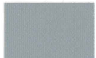
T-21 シルバー [透光率:0%]