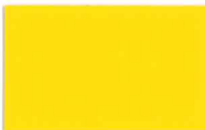
T-11 イエロー [透光率:5.9%]