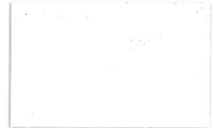
T-18 ホワイト [透光率:4.9%]