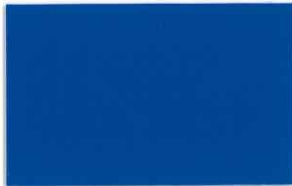
T-01 ロイヤルブルー [透光率:0%]