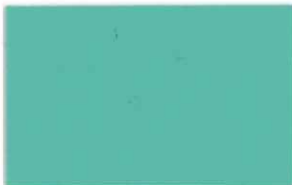
T-04 エメラルドグリーン [透光率:0.2%]