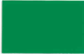
T-09 フォレストグリーン [透光率:0.2%]